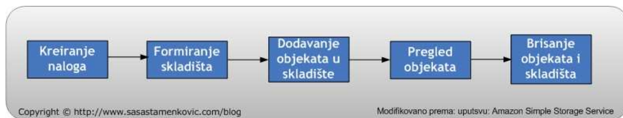
Slika 1.4. Upravljanje S3 servisom

S3 servis: Reč je o Web based servisu koji je prvenstveno namenjen uskladištenju velike količine podataka kojima se pristupa podešavanjem jedinstvenih parametara koristeći AWS Management konzole. Na sledećoj slici ukratko je predstavljen tok upravljanja sa pomenutim Web servisom.